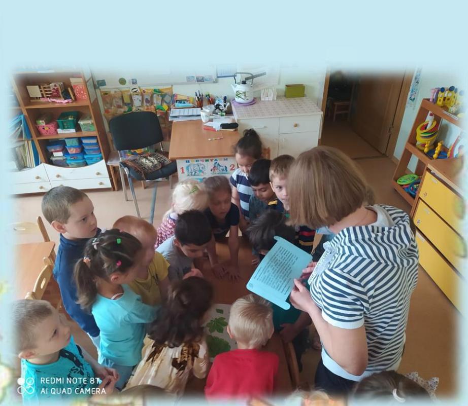
Ребята получают посылку от детей из Москвы. Читают письмо, рассматривают содержимое и собираются на улицу.