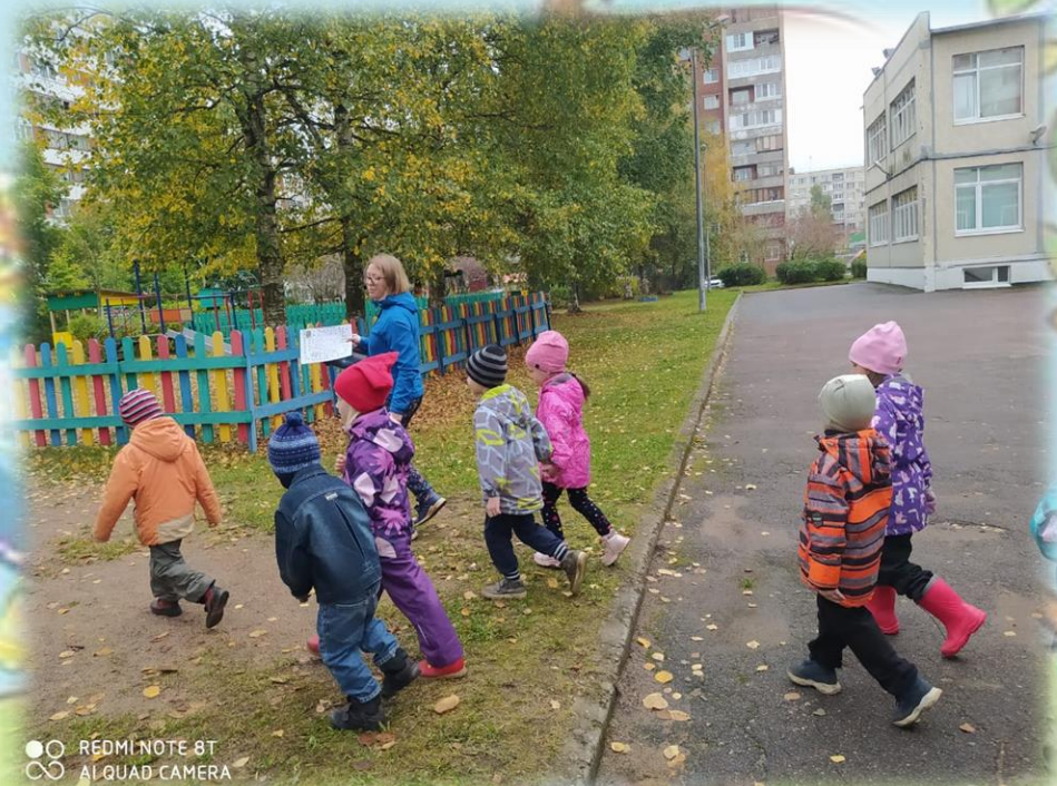
Встречаемся с ребятами на улице, рассматриваем карту, определяем путь следования.