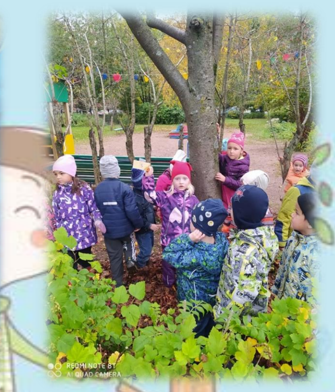
Продолжаем следовать по маршруту. Собираем с ребятами листья с деревьев, на которых были карточки для того, чтобы составить гербарий и отправить детям в Москву.